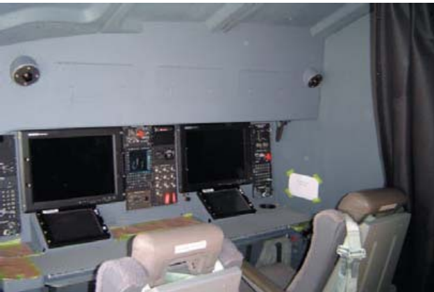
Workstation aboard an HC-130J 2