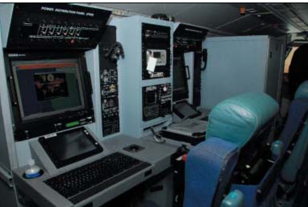
A Mission System Pallet aboard the HC-144A 2